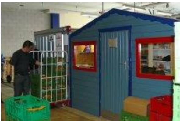
Kantoortje in het nieuwe distributiecentrum

Op 29 april jl. heeft de officiële en feestelijke uitnodiging plaatsgevonden. Hierbij waren veel vrienden van de Voedselbank aanwezig. We hebben op die dag ook aandacht besteed aan ons 10-jarig bestaan.