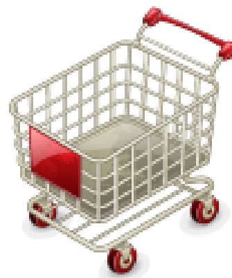
Inzamelacties in supermarkten